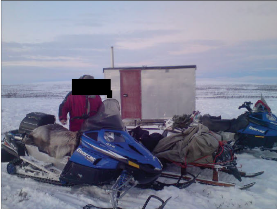
Snøskuter er det naturlige fremkomstmiddelet og arbeidsverktøyet om vinteren.