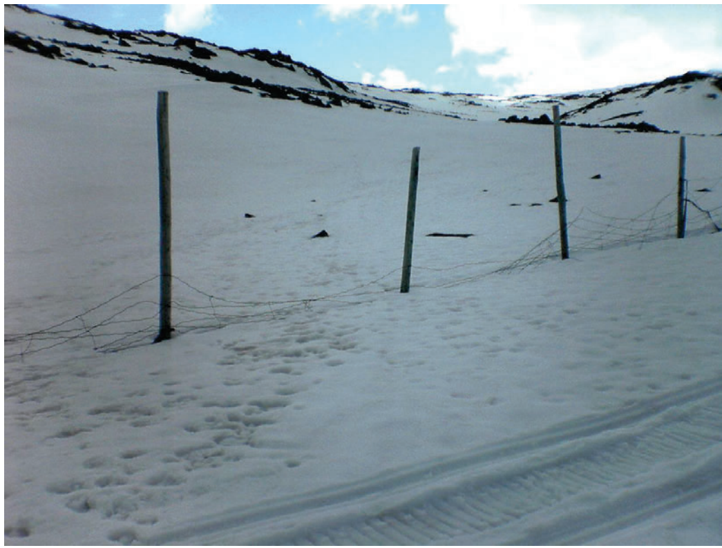
Deler av grensegjerdet er i meget dårlig forfatning og har liten nytte i å hindre vandring av rein over riksgrensen mellom Norge-Finland.

det er nødvendig at det opprettes en permanent tilsynsordning langs grensen om vinteren.