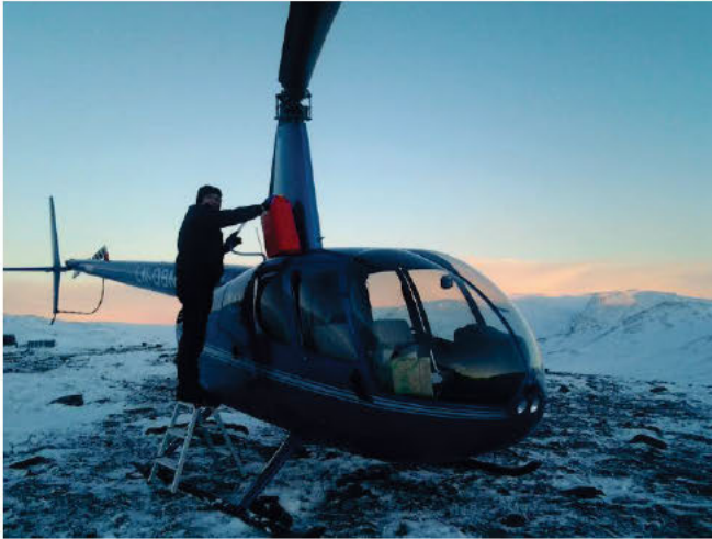
Iblant kan det være nødvendig å leie inn helikopter i forbindelse med samling og driving.