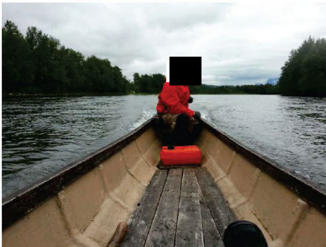
Elvebåt benyttes under patruljering langs Reisaelva.