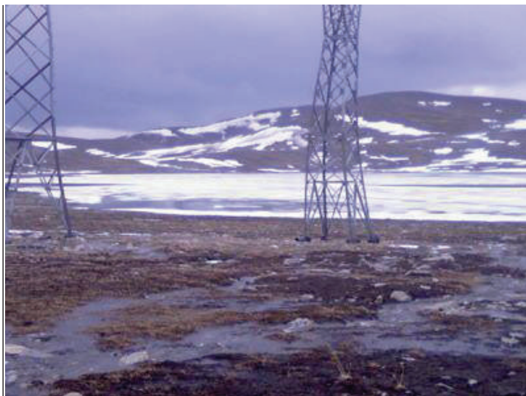
Langs Njuorojávri går det kraftførende 320 kV linjer.

Det finnes tre vann som er oppdemmet innenfor reinbeitedistriktet. Disse er Guolášjávri (Kåfjord), Kildalsdammen (Nordreisa) og Sikkájávri (Nordreisa). Distriktet får årlig økonomisk erstatning for disse. Det er utarbeidet egne anleggsveier til disse områdene og de er åpne for allmenn ferdsel. Dette fører til at reinsdyrene instinktivt trekker bort fra disse områdene. De negative effektene er av regional art og mye beiteland går dermed tapt på grunn av dette.