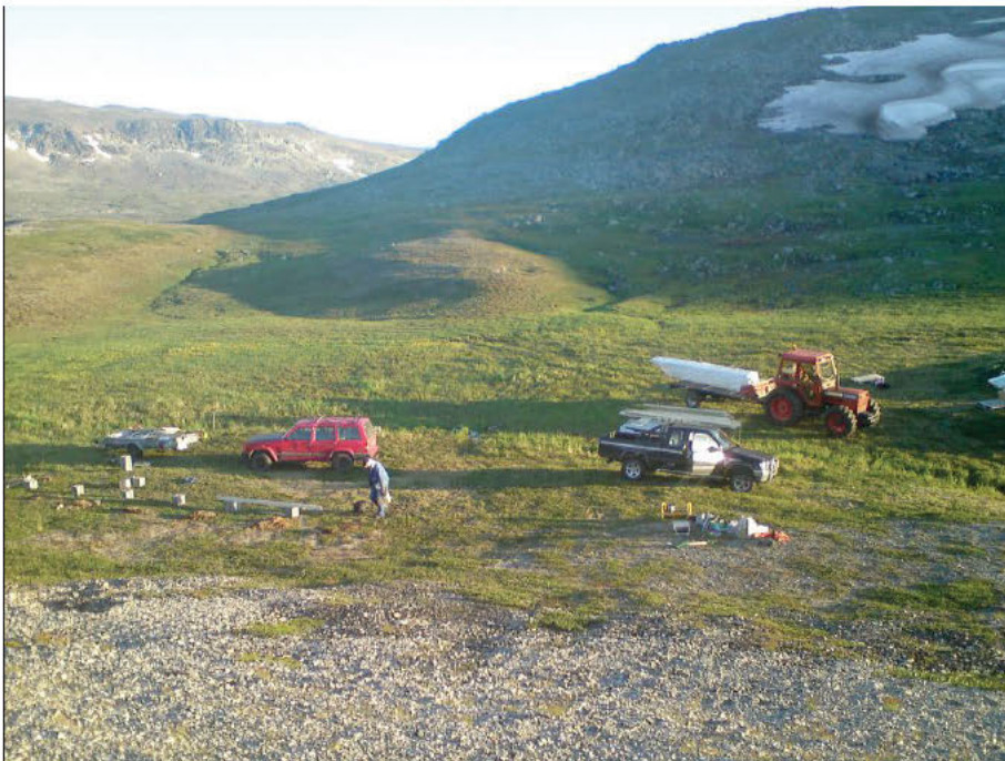
I enkelte områder av distriktet går det anleggsvei opp til fjellet og biltransport benyttes ved behov.