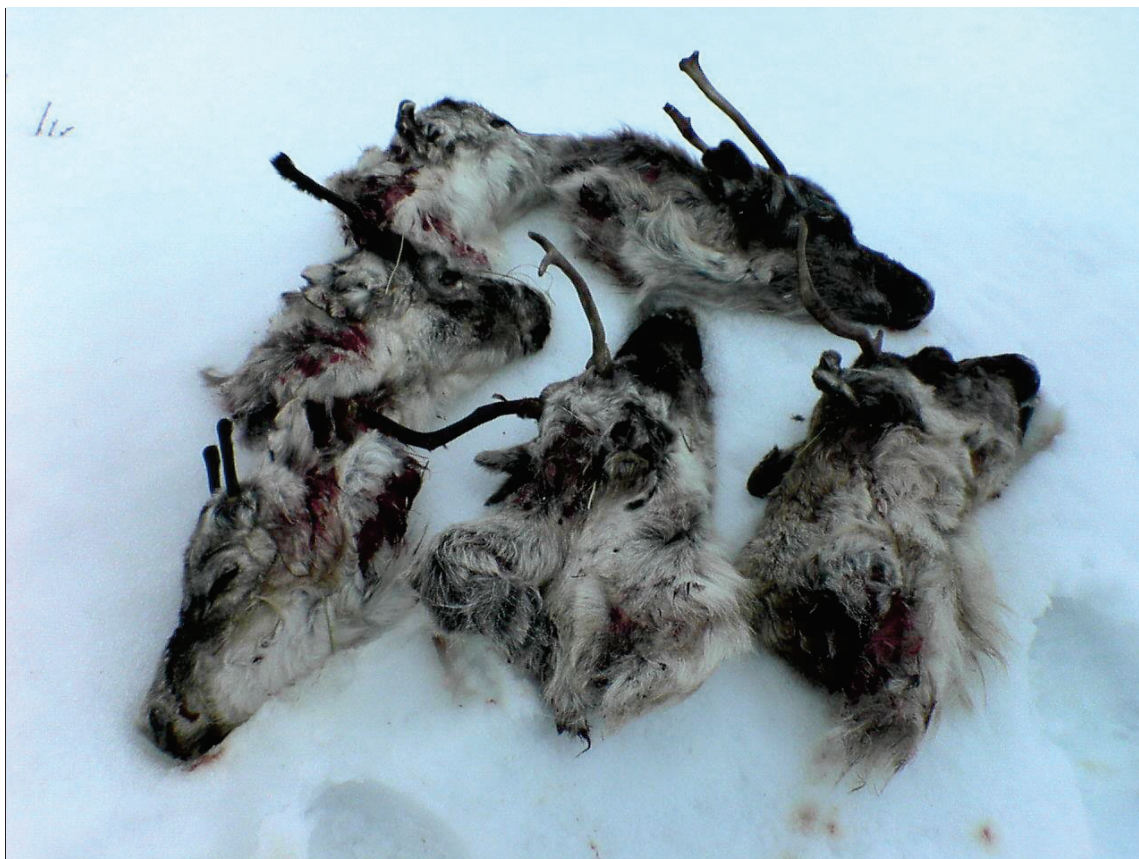
Det er ikke uvanlig å finne flere kadavre samtidig.

I tillegg til at rovdyr dreper reinsdyr så skaper disse også stor forstyrrelsesfaktor i form av at reinsdyr er urolig på beite, unnviker store deler av distriktet og må vandre mye. All reindriftskompetanse tilsier at dette er uheldig for reindriften, når reinsdyrene ikke kan utnytte all beitemark og vandring derimot fører til lettere (magrere) reinsdyr. Dalområdene er spesielt gode trivselsområder for rovdyr og det er nettopp her de beste beiteområdene er.