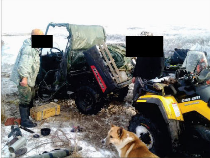
ATV er et nødvendig fremkomstmiddel og arbeidsredskap i dagens reindrift. 4-hjuls-kjøretøy benyttes i barmarksperioden, fra sen vår til sen høst.