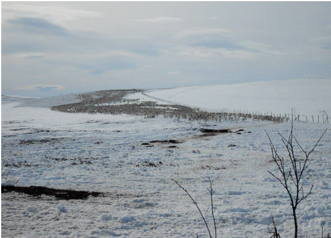
En del av flokken på vårflytting i Dáinnáčearru.

Reinbeitedistriktet har i sine bruksregler vedtatt at distriktets flokk vil oppnå beste resultater med en reinflokk med slingring mellom 7500 og 8000, etter slakting og andre avganger (pr. 31.3). Gjennom hele året vil det reelle reintallet variere kontinuerlig, pga kalving, rovdyrtap og andre avganger.