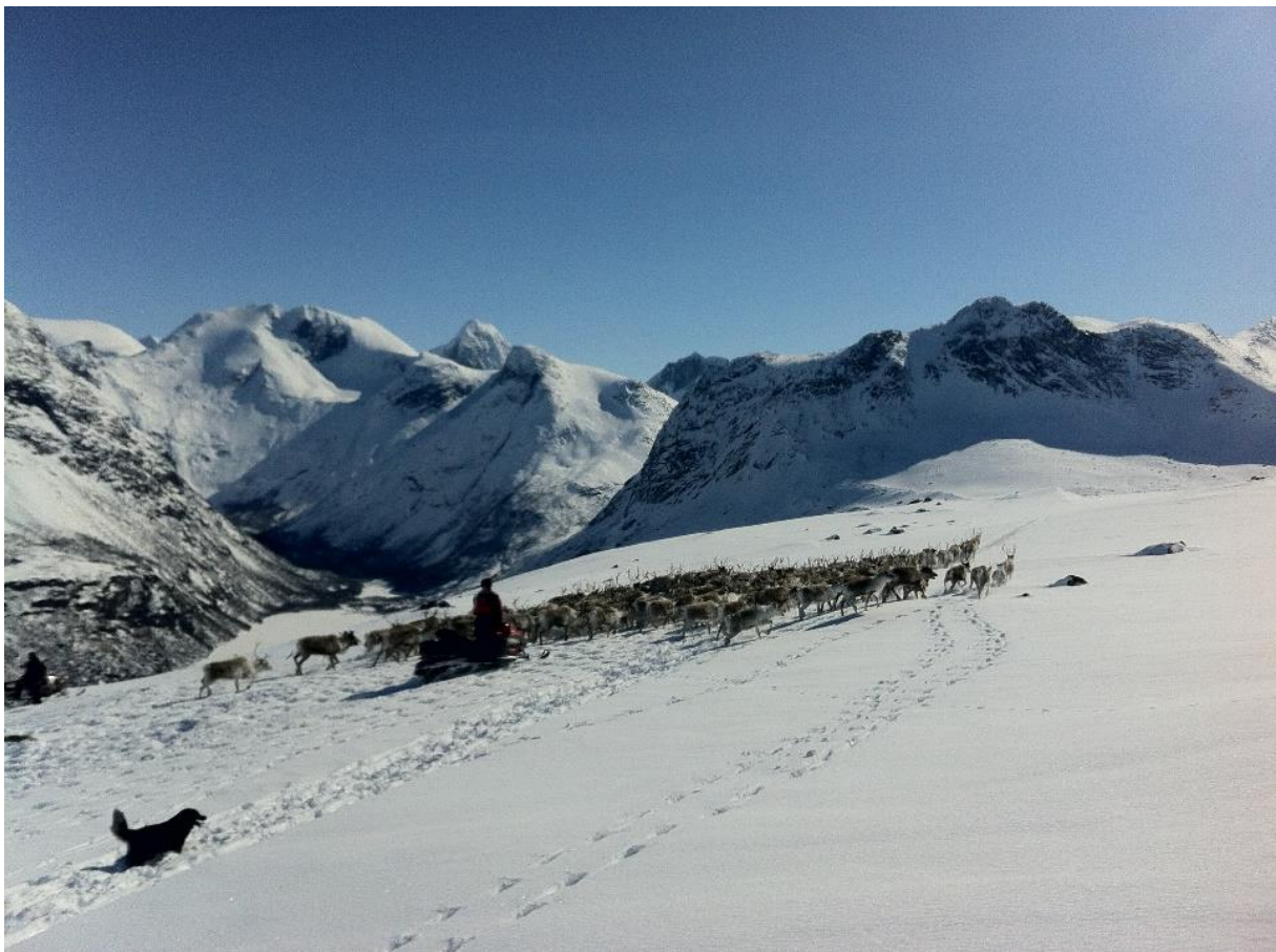
Figur 5 Vårflytting av rein mot Håkvikdalen. Skamdalsvatnet vises til venstre i bildet, og Tverrdalsfjellet til høyre.

Særlig vil trange dalfører fungere som flaskehals for rein som skal opp og ned til beiteområder. Disse dalførene er ofte eneste passasje mellom beiteområdene og en forhindring på et slikt område vil påvirke reinens trekkmuligheter.