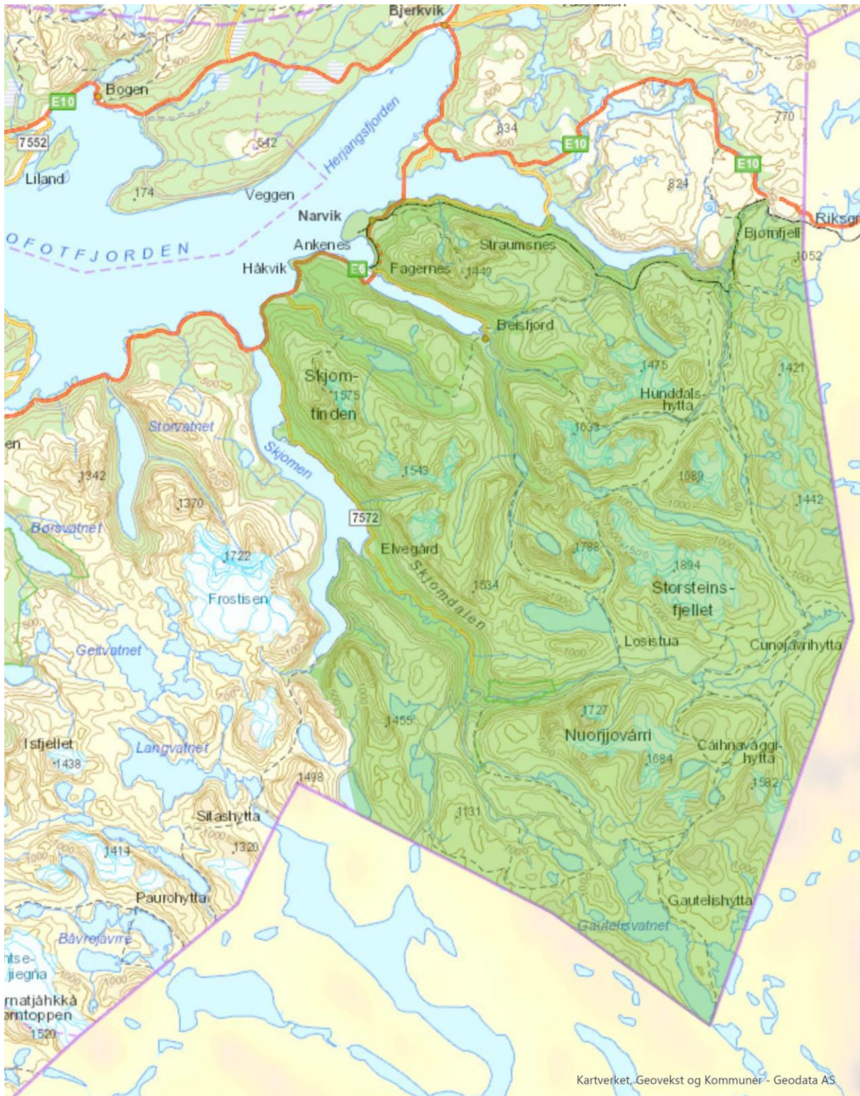
Figur 3 Skjomen reinbeitedistrikt markert med grønt