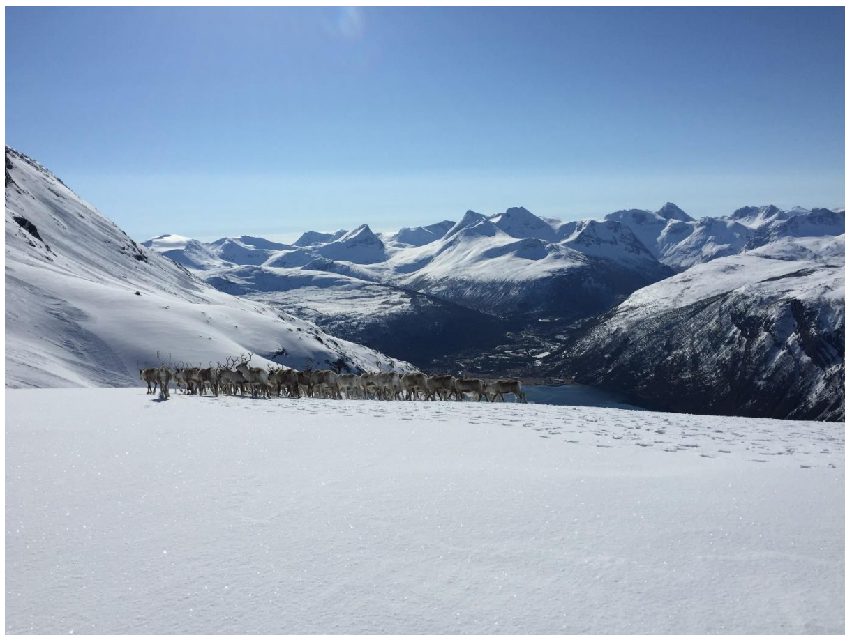
Figur 1 Vårflytting mot kalvingslandet fra Tøttadalen og mot Beisfjord. Beisfjord sees i bakgrunnen.