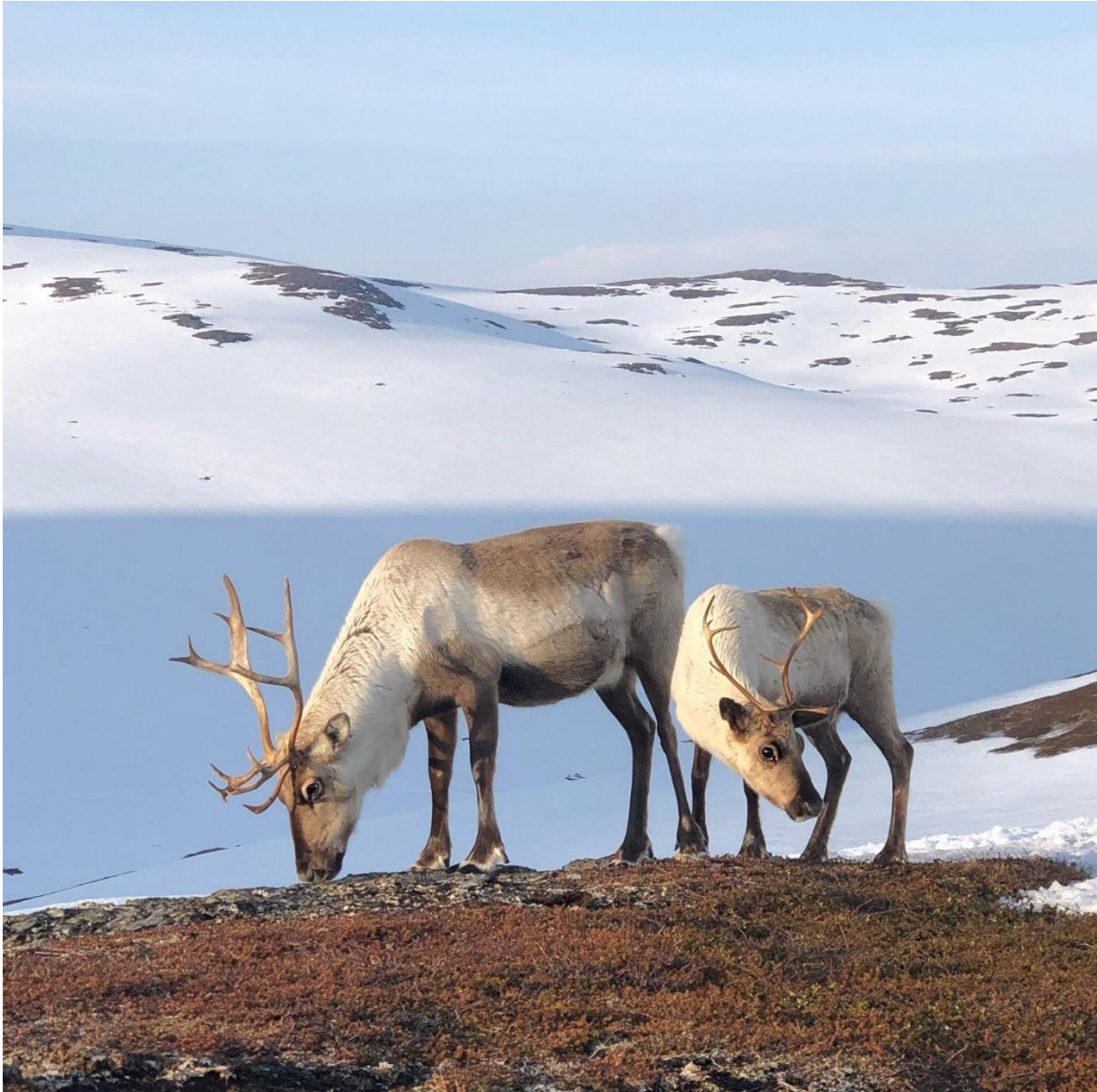
Figur 4 Drektige simler på kalvingslandet. Foto er tatt nord for Rosmmosčohkka.