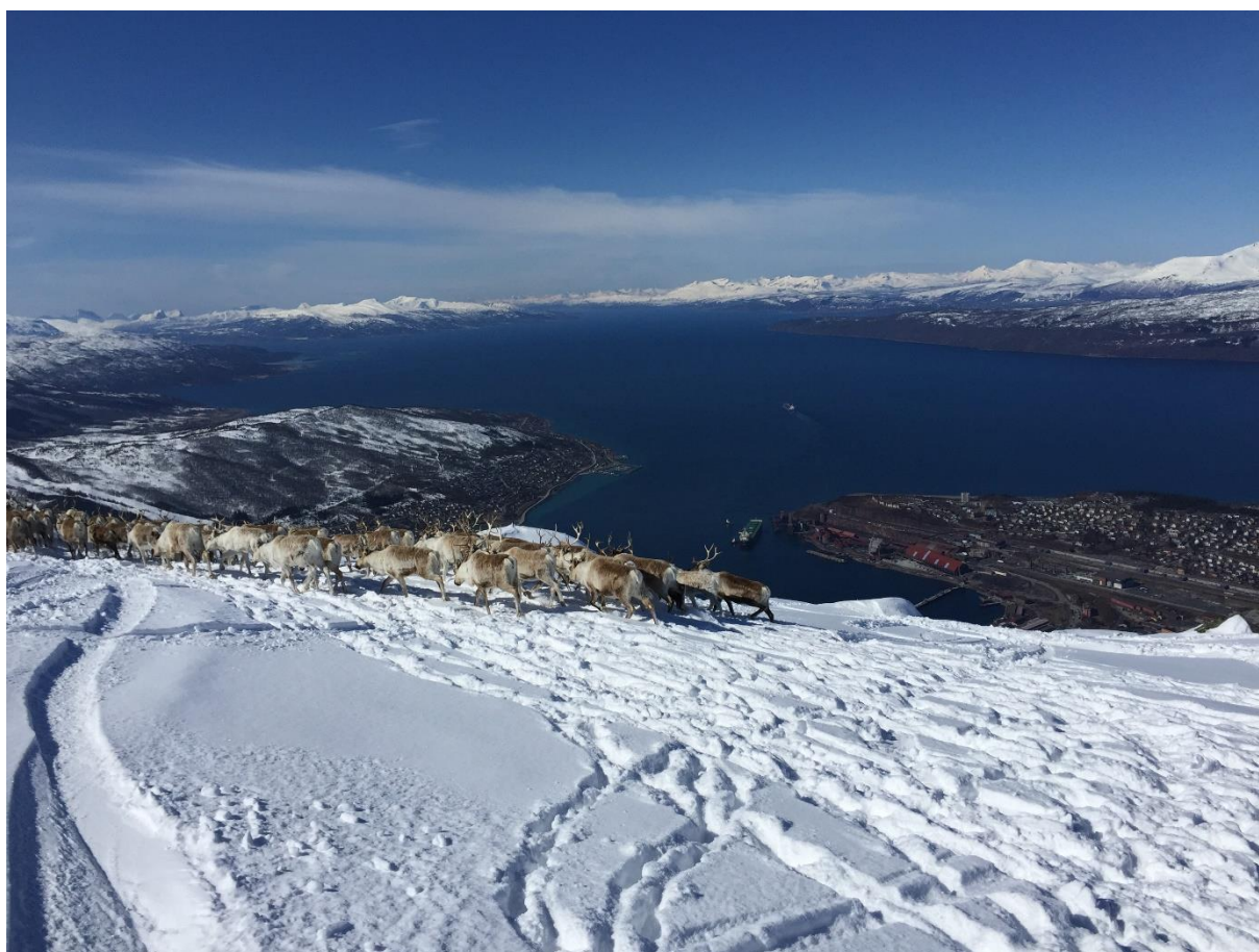
Figur 10 Foto viser vårflytting av rein fra Tøttadalen rundt Fagernesfjellet ved Narvik og mot Beisfjord. Narvik sees i bakgrunnen.

Distriktet har vært i møte med Narvik skiklubb angående utbedring/bygging av ny trase inn til Pumpvatnet. Her har distriktet sagt klart ifra at vi ikke ønsker noen skiløype/trase videre forbi Funnhytta og inn i Tøttadalen. En slik løype vil presse bort rein som beiter inne i Tøttadalen og Tøttarota.