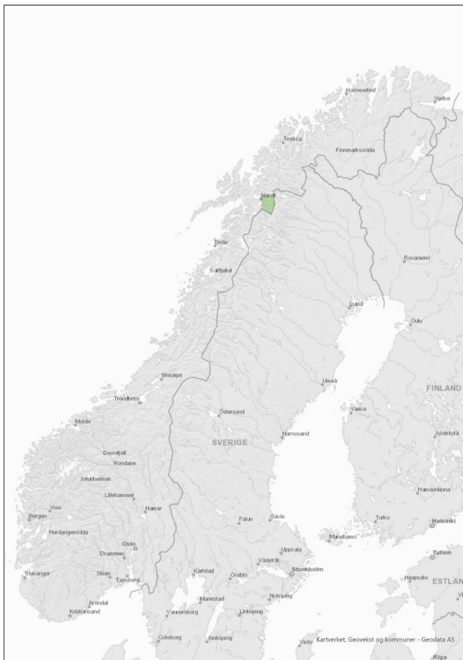
Figur 2 Skjomen reinbeitedistrikt markert med grønt.

Distriktsplanen For Skjomen reinbeitedistrikt er lagt frem for styret 17.05.2020, og er vedtatt på årsmøte juni 2020.