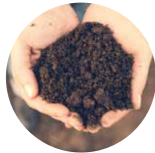
Lite kunnskap om viktigheten av matjord