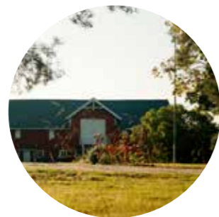
Landbrukets egen nedbygging