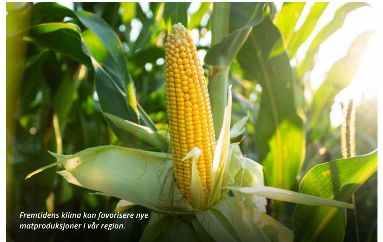
Fremtidens klima kan favorisere nye matproduksjoner i vår region.