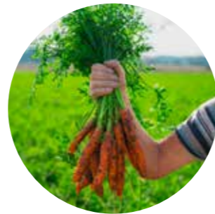
Lite kunnskap om landbruksnæringen