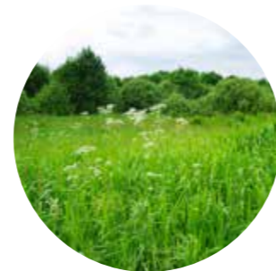
Holde matjorda i drift