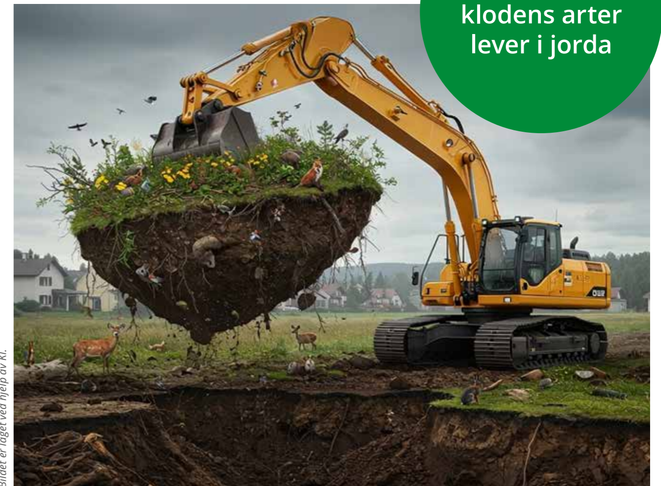
Bildet er laget ved hjelp av KI.

Over 50 % av klodens arter lever i jorda