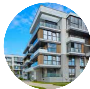
Utbygging til bolig og næring