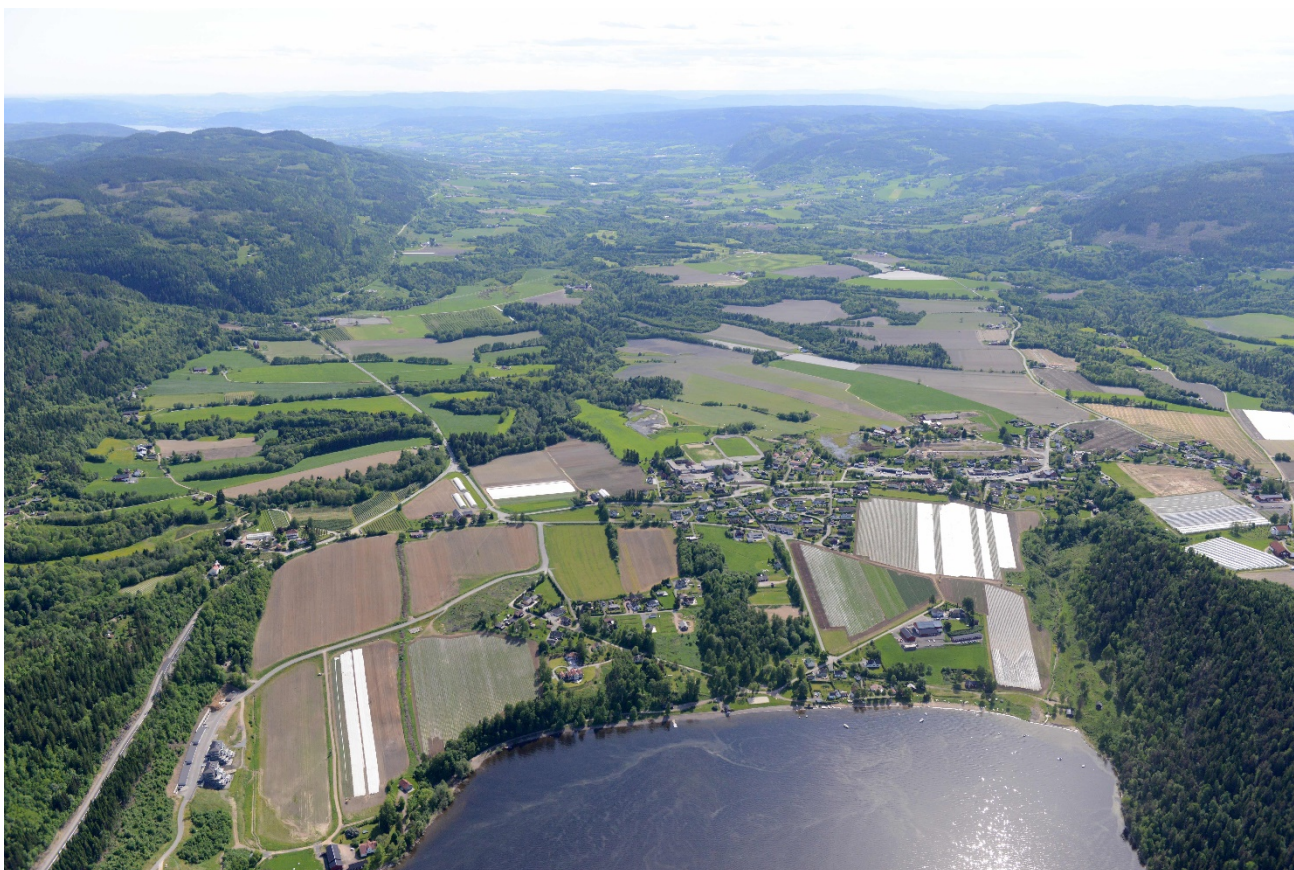
Figur 1. Sylling sett fra nord med Hølsjøen i forgrunnen Foto: Lasse Tur, 2012

Jordvern er også viktig for å bidra til globale bærekraftsmål, og dokumentet fremhever behovet for å bevare jordens fruktbarhet og sikre matsikkerhet for kommende generasjoner.