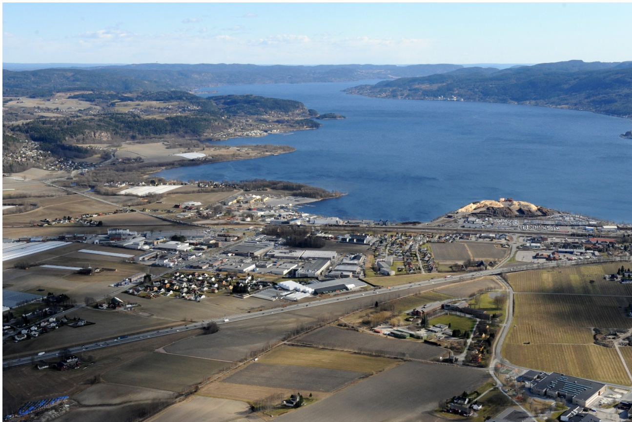
Figur 2. Foto: Lasse Tur (Lier sett fra oven, 2012)

utenfor fulldyrka jord om mulig. Driftsbygninger må være nødvendige basert på eiendommens areal og drift, ikke eierens subjektive oppfatning. Bygninger for lagring og bearbeidelse av egne planteprodukter regnes som jordbruksproduksjon, men ikke salgsbygninger. Drivhus regnes som jordbruksproduksjon hvis jorda brukes direkte.