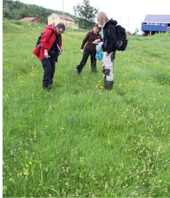
Figur 4. Illustrasjonsfoto: Befaring med skjøtselsplanskrivere og grunneier i slåtteeng på Sør-Åkerøya i Alstadhaug kommune.

Våre resultater viser at det er grunneiere uten skjøtselsplan som har lengst kontinuitet i skjøtselen. Blant de som har fått utarbeidet skjøtselsplan er det en tendens til noe mer modernisering og en forenkling av skjøtseltiltakene. Mangel på beitedyr fører for eksempel ofte til at tradisjonelle og nødvendige skjøtseltiltak forsvinner fra slåttemarkene. Det er likevel