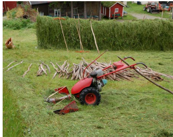
Figur 6. De aller fleste anvender tohjuls- slåmaskin i de artsrike slåttemarkene og tørker høyet på bakken. Høyet hesjes og anvendes oftere som fôr til egne dyr hos grunneiere uten skjøtselsplan enn hos de som har skjøtselsplan.

Prosjektet er finansiert av Landbruksdirektoratet, gjennom Klima- og miljøprogrammet.