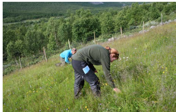
Figur 5. Illustrasjonsfoto: Grunneiere motiveres til å gjøre skjøtseltiltak, blant annet for å ta vare på det biologiske mangfoldet og tradisjonene som er knyttet til dem. Her leder grunneierne etter marinøkler i slåttemarka si i Hydalen i Hemsedal.

For den aktive bonden, som har gården som levebrød, er størrelsen på tilskuddssatsene for skjøtsel viktig. For disse må det være økonomi både i selve gårdsdriften og i skjøtselen. Noen forteller også om at de får reduserte tilskudd, i tilfeller der deres slåttemark overflyttes til andre tilskuddsordninger (for eksempel