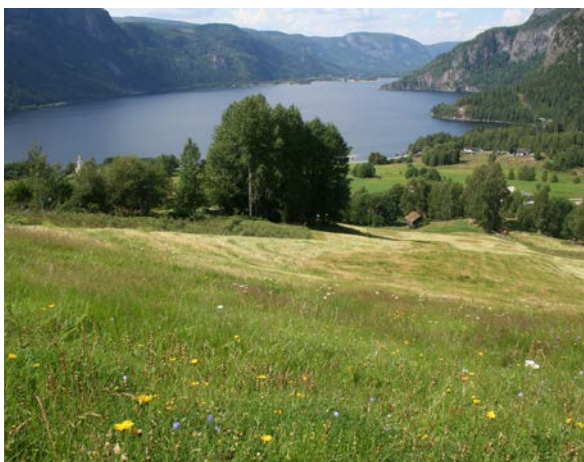
Figur 3. Åraksbø i Bygland kommune. I forgrunnen ses ei artsrik slåttemark som ligger inntil ei grovføring der det høstes vinterfôr til sau.

Vi har innhentet datamateriale gjennom en digital spørreundersøkelse rettet mot tilskuddsmottakere